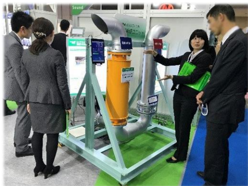
～展示品：消音器体感ユニット～