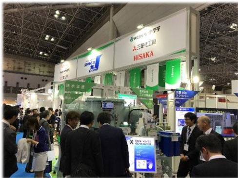
～3社共同出展ブース(弊社側)～